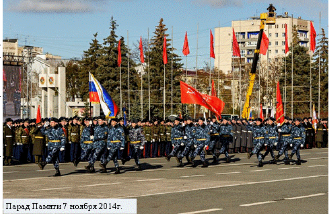
Парад Памяти 7 ноября 2014г.

Каждый из нас может чем-то помочь. Для начала поблагодарить искренне и с душой. Если в