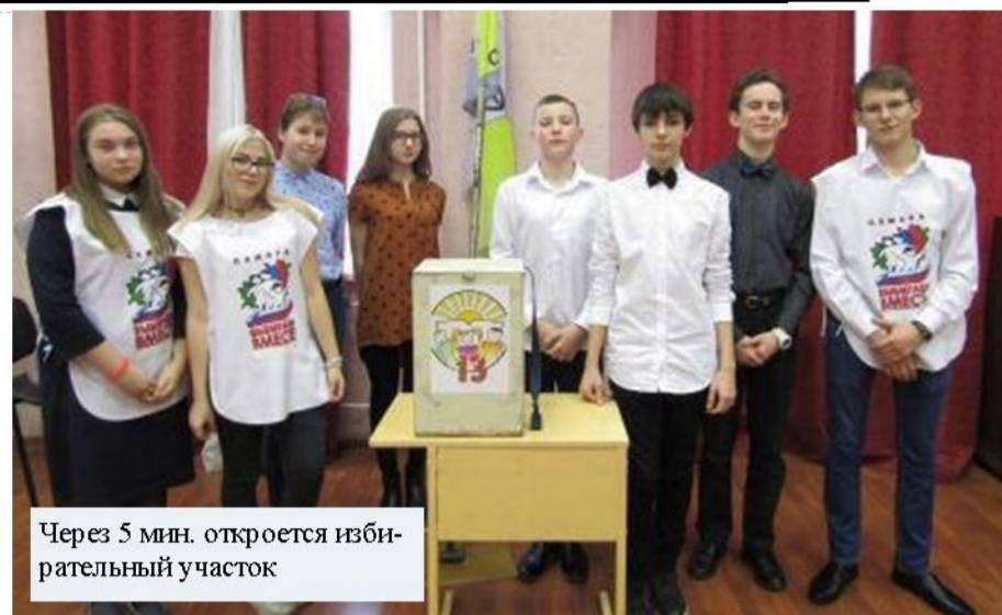
Через 5 мин. откроется избирательный участок

12 октября 4 кандидата вновь встретились в актовом зале для того, чтобы представить программы улучшения